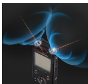
「トゥルーステレオマイク」イメージ図

ローノイズの指向性マイク2個を90度の角度で配置した「トゥルーステレオマイク」を搭載しています。このマイク配置により、話者のポジションや距離感までもリアルにとらえて録音することができます。