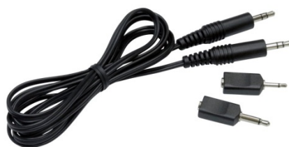
コネクティングコード「KA333」

貴重な音声を記録したカセットテープからデジタルデータへの変換、記録もコネクティングコード「KA333」との組み合わせで可能になります。このコードはカセットテープ再生機側のイヤホンジャックと「Voice-Trek V-863」「Voice-Trek V-862」のマイクジャックをつなぐもので、状況に合わせて利用できるステレオ→モノラル変換プラグが同梱されています。