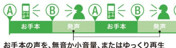
「シャドーイング」作動イメージ図

ビジネスマンのスキルアップとして需要の高い語学学習に効果的な「シャドーイング」を備えています。「シャドーイング」とは音声再生と無音再生を繰り返すモードで、手本の音声に続く無音再生部に発声することでリスニングと発声、両方の効果的な練習が行えます。「Voice-Trek V-863」および「Voice-Trek V-862」では「シャドーイング」時に手本となる音声の速度を落とす「ゆっくり」再生モードが選べるため、慣れないうちは速度を落として再生される手本を聞きながら、ゆとりをもって練習できます。