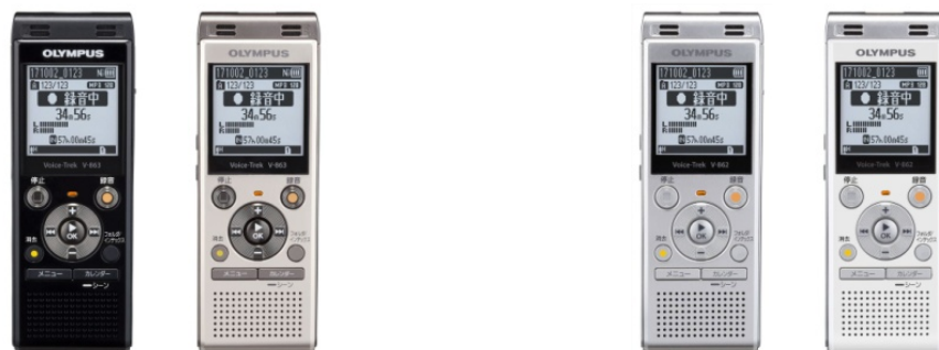
Voice-Trek V-863 (ピアノブラック/シャンパンゴールド)