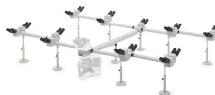
マルチディスカッションシステム(18人用)