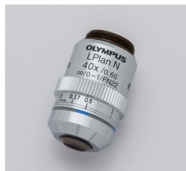
補正環付き対物レンズ「LPLN40X」