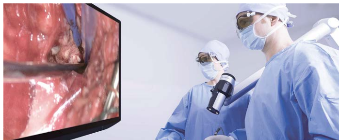
ORBEYE を用いた手術風景