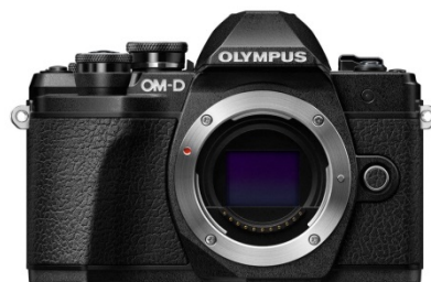
＜OLYMPUS OM-D E-M10 Mark III＞ (ボディー色ブラック)