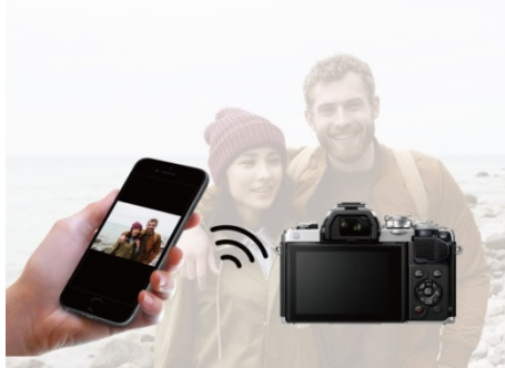
スマートフォンとの連携で、画像の転送、シェアが行える(操作イメージ)

撮影した写真を SNS 等にアップする、あるいは写真を知人とシェアすることを多くの方が楽しんでいきます。「OM-D E-M10 Mark III」は Wi-Fi を内蔵し、スマートフォンアプリ「OLYMPUS Image Share」を使うことで、スマートフォンやタブレットに手軽に接続、撮影した画像 ※4 を転送し、SNS 等にすばやくアップロードできます。接続はカメラの背面液晶に表示される QR コードをスマートフォンに読み込ませるだけの簡単操作。その他にもスマートフォンをリモコンにして記念写真を撮る ※5 、あるいは写真を撮った場所を地図データ上に表示するための GPS 情報を追加することもできます。