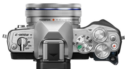
操作性を考慮して設計された ダイヤル、ボタン類

ボディはOM-Dシリーズ共通の端正なスタイルを引き継ぎ、高品位でクラシックなデザインに仕上げられています。アクセサリとしては新たに専用の本革ボディージャケット「CS-51B」を用意しています。同素材、同色の本革ショルダーストラップ「CSS-S109LL II」、本革レンズジャケット「LC-60.5GL」と合わせて、一体感のあるコーディネートが楽しめます。