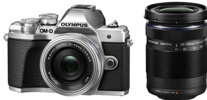
<OLYMPUS OM-D E-M10 Mark III EZダブルズームキット> (ボディ色シルバー)

「OLYMPUS OM-D E-M10 Mark III」 + 「M.ZUIKO DIGITAL ED 14-42mm F3.5-5.6 EZ」※1 + 「M.ZUIKO DIGITAL ED 40-150mm F4.0-5.6 R」※2