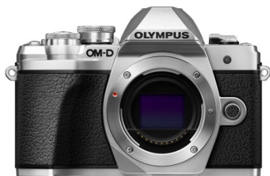
＜OLYMPUS OM-D E-M10 Mark III＞ (ボディー色シルバー)