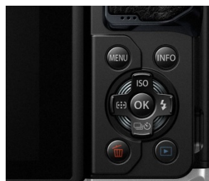
カメラ背面に設けられた十字キー