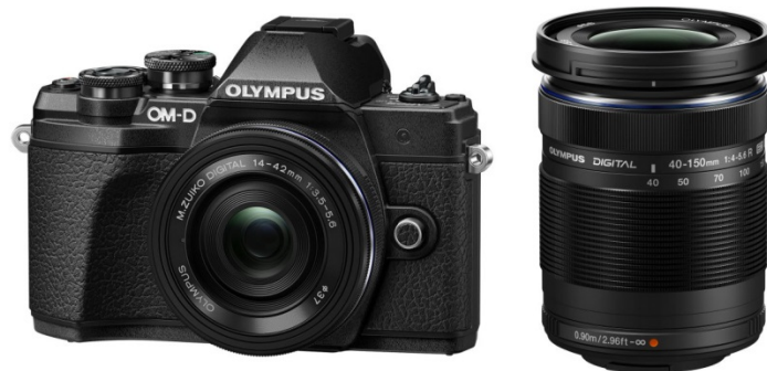
＜OLYMPUS OM-D E-M10 Mark III EZダブルズームキット＞ (ボディー色ブラック) 「OM-D E-M10 Mark III」 + 「M.ZUIKO DIGITAL ED 14-42mm F3.5-5.6 EZ」 + 「M.ZUIKO DIGITAL ED 40-150mm F4.0-5.6 R」