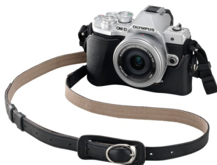
本革ボディージャケット「CS-51B」および 本革ショルダーストラップ「CSS-S109LL II」 (ブラック色)を装着したコーディネート例

「OM-D E-M10 Mark III」に合わせて新設計された専用の本革ボディージャケットです。カメラボディーを傷から守り、本革ならではの高級感により、カメラを持つ楽しみがさらに深まります。カラーはブラックとなります。さらに発売中の同素材、同色の本革ショルダーストラップ「CSS-S109LL II」、本革レンズジャケット「LC-60.5GL」とのコーディネートが楽しめます。