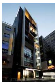
『GEMS 渋谷』 2012 年 10 月開業

当社では、引き続き『GEMS』ブランドの都市型商業施設のほか、今後様々な商業施設の開発を進めていき、「 あした 未来につながる街づくり」と「豊かな時を人びとと共に育む」事業を推進してまいります。