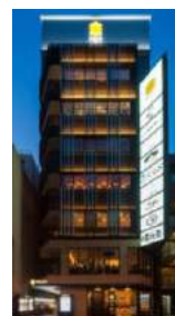
『GEMS 神田』 2016 年 7 月開業