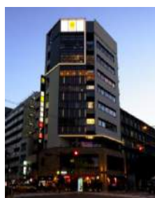
『GEMS 市ヶ谷』 2014 年 11 月開業