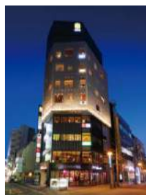
『GEMS 大門』 2016 年 3 月開業