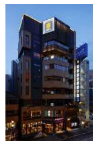
『GEMS 恵比寿』 2017 年 9 月開業