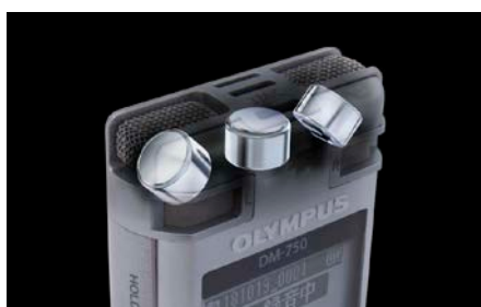
3マイクシステム「TRESMIC」イメージ

音楽録音用の高音質のICレコーダーにも採用されている3マイクシステム「TRESMIC」(トレスミック)を搭載しています。高性能指向性ステレオマイクに加え、無指向性のセンターマイクを加えたシステムにより、低音域から高音域まで幅広い音域を原音に近い自然な音でのステレオ録音を可能にします。リアPCMの録音形式とのコンビネーションで、ビジネスシーンを高音質で記録します。