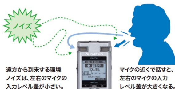
「2マイクノイズキャンセル」動作イメージ図

「Voice-Trek DM-750」には、一般的なICレコーダーでは環境ノイズにまぎれて聞き取りにくくなるような状態でも、音声のみをクリアに録音できる新機能の「2マイクノイズキャンセル」が搭載されています。この機能は音声と環境ノイズの左右のマイクに入る入力レベル差をレコーダーが判別することで、周囲が騒がしい状況下でも音声をクリアに録音してゆくものです。