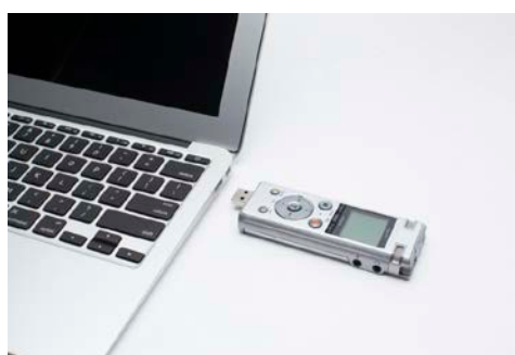
「PC ダイレクト接続」使用イメージ