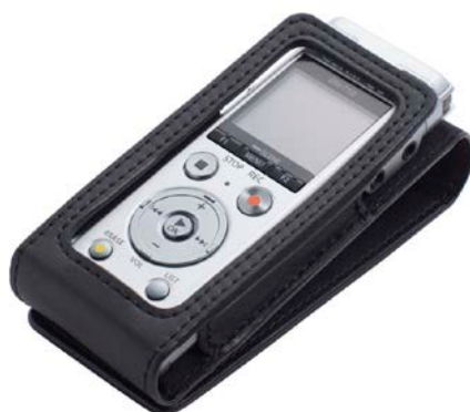
別売キャリングケース「CS150」使用イメージ

シックなレザー調の素材で中に入れた「Voice-Trek DM-750」をショックやキズから守ります。