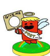
エンジェルポスト