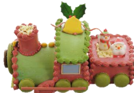
「きかんしゃノエル」(2011)