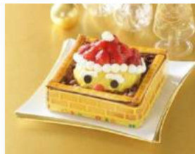
「チョコレートのえんとつからいちごさんがやってくる！」 (2015)