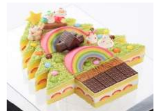
「クリスマス レインボー ケーキ」(2016)