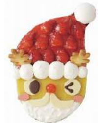
「トナカイくんのサンタコスプレ!!ケーキ」(2012)