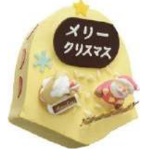
「ベルー★クリスマス」(2010)