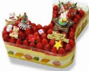
「ブーツの中からプレゼントがいっぱい」(2009)