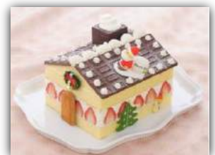
「クリスマスイブの夜...サンタさんがやってきた！」 (2014)