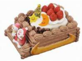
「サンタさんがソリに乗ってお届けケーキ!!」(2013)