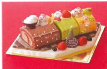
「クリスマスきかんしゃロールケーキ」(2017)