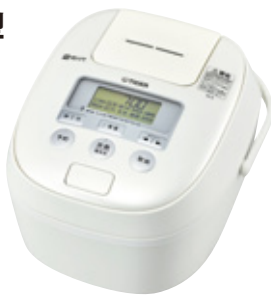
ミルクィーホワイト(WM) JPE-B1型