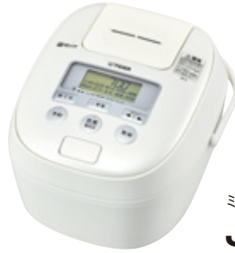
ミルクィーホワイト(WM) JPE-B1型