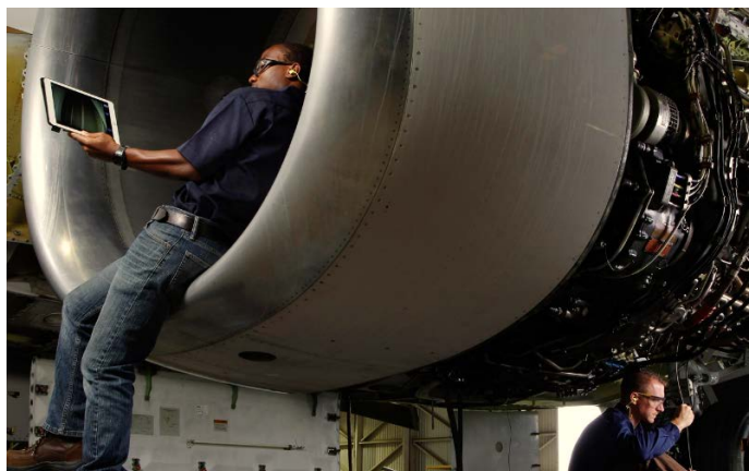
検査映像を共有するライブストリーミングの使用イメージ