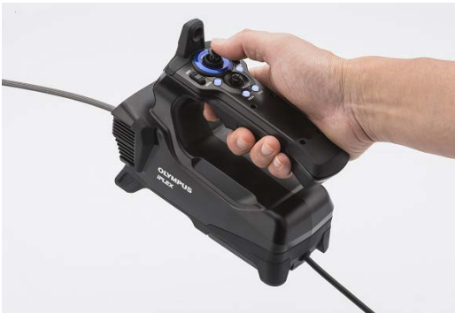
重量バランスを最適化したコントローラー

作業者の負担軽減を目指し、コントローラーの重量バランスを最適化しました。これにより安定感と軽さを実感できるデザインへ生まれ変わっています。またスコープ先端の湾曲操作も完全電動化しています。繊細なスコープの動作も、軽いスティック操作で狙い通りに行うことが可能です。従来よりも操作が軽くなったことで指にかかる負担が抑えられ、長時間の検査であっても作業者の疲労が軽減します。さらに新機能として、タッチパネルでのスコープ湾曲操作も実現しました。作業スペースが限られる製造ラインの検査などでは、コントローラーを持つことなくモニターで直感的に操作可能です。