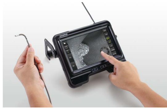
タッチパネルによるスコープ湾曲操作