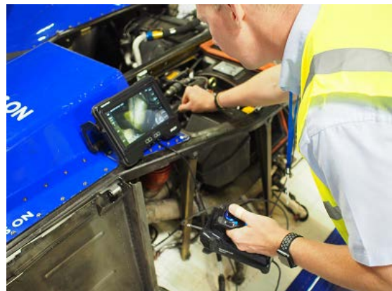
工業用ビデオスコープ「IPLEX GX/GT」