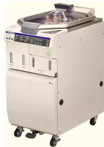
内視鏡洗浄消毒装置 OER-5