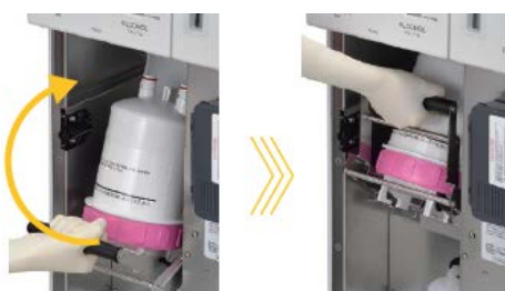
水フィルターの交換

洗浄消毒後の内視鏡に水道水の雑菌が付くのを防ぐため、装置の内部に「水フィルター」を設置して定期的に交換する必要があります。従来品は、専用の工具を用いてフィルターを取り外す必要がありましたが、OER-5 では効率的なワンタッチ交換が可能になりました。また、これまでは屈んだ姿勢で行っていた消毒薬の濃度チェックが立ったまま行えるようになり、煩雑な作業が不要になりました。