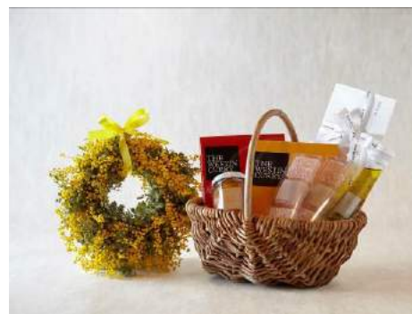
HAPPY YELLOW チャリティーギフトワゴン HAPPY YELLOW ハンパー