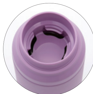
ストレーナーつきせん

ボトル本体の口径は約5.3cm。夏場には大きな氷を入れることができます。また、口当たりのよいストレーナーつきの飲み口が氷止めになり、ストレスなく冷たい飲み物を飲むことができます。冬場のスポーツシーンでは、熱い飲み物を入れたときに勢いよく飲み物が出ることを防ぐことができ、飲みやすさを計算した構造になっています。