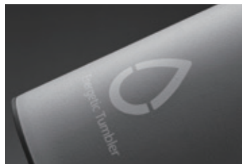
パウダーコーティング加工

また、フィットネススタジオなどの床に傷がつきにくく、滑りにくいように、底をクッション性のあるゴム状弾性の「エラストマー」を採用いたしました。スポーツシーンにおいて快適にご使用いただくことが可能です。