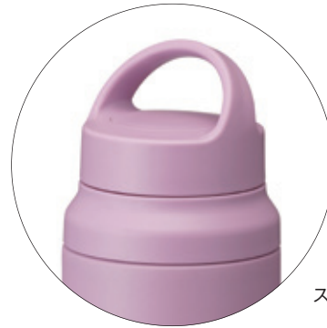
スラントハンドル 拡大図