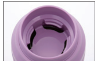
ストレーナーつきせん