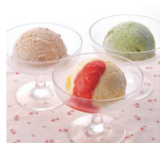
3種のアイスクリーム &いちごのソース