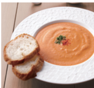
簡単ビスク風スープ