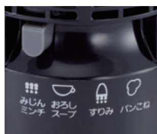
調理コースはレバーで簡単切り替え