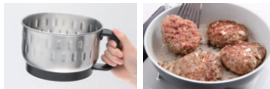
4人分のハンバーグのたねが一気に作れます