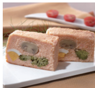
簡単サーモンテリヤヌ