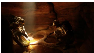
SWEET NOTES (包み込む甘美) かすかに光るゴールドの液体