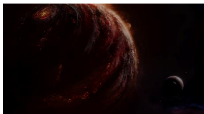
INFINITE ECHO (永く続く余韻) 永遠に続く星雲の世界