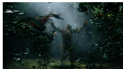
WOOD CRUNCHES (オークノート) 青々とした森林の中の目に見えないスビリッツの存在