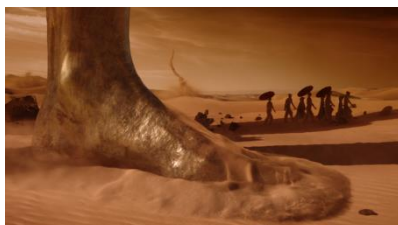
RINSING HEAT (眩い灼熱) 灼熱の中、 ブロンズの巨人の影を歩く