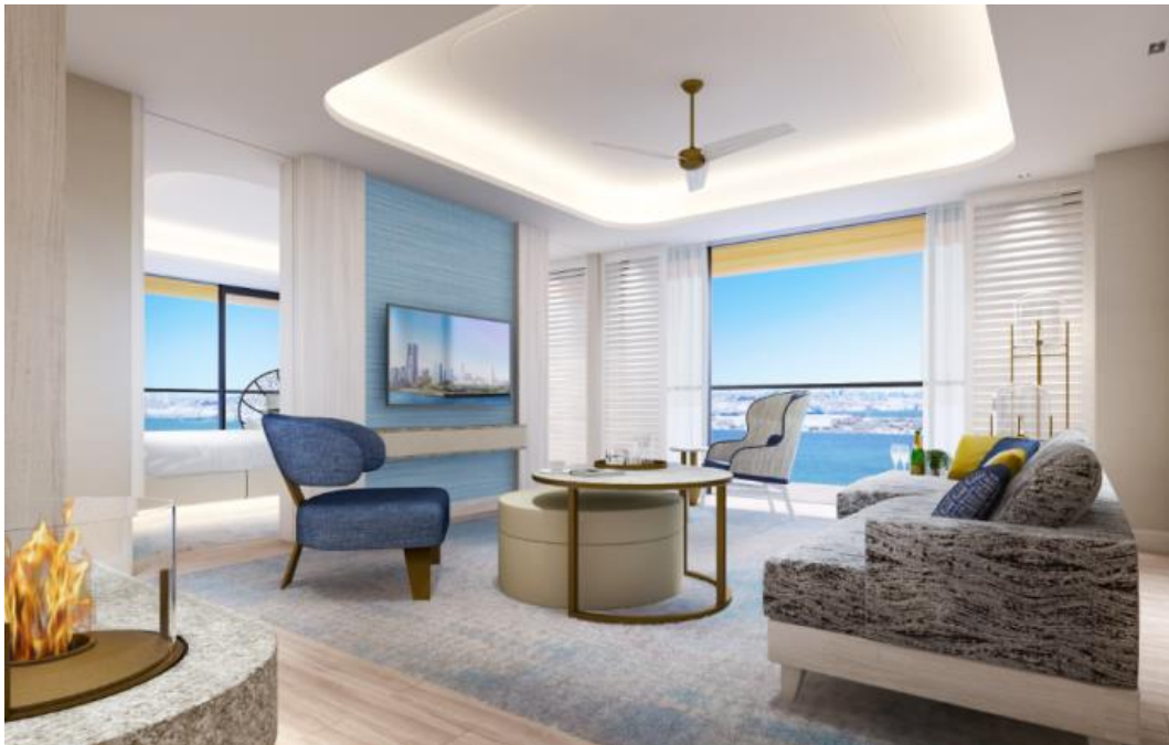
スイートルーム (イメージ)

ワールドクラスの数々のビッグイベントも控え、また横浜港のさらなる開発を受け、国内外から多くのお客さまが訪れる横浜・みなとみらい。「インターコンチネンタル横浜 Pier 8」は2019年11月、この地から新しい歴史を刻んで参ります。