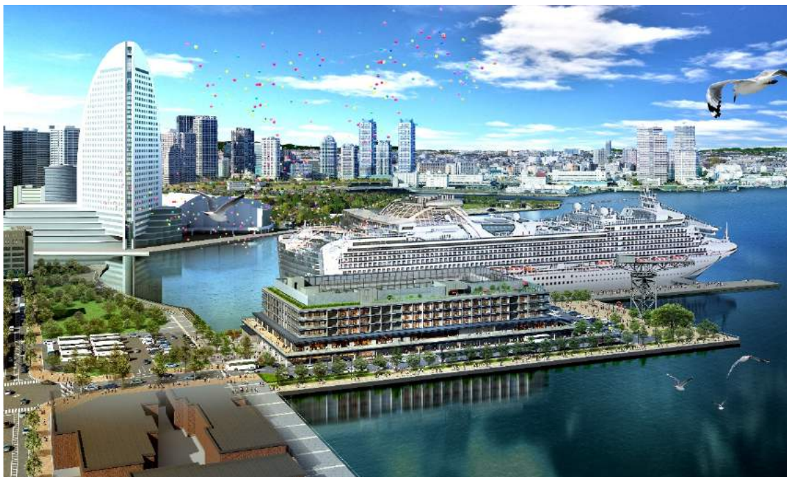
ダイヤモンド・プリンセス入港時のイメージパース

横浜港の中でも新港ふ頭客船ターミナルは、11万6千総トン級の客船にも対応できるよう、公共岸壁の改良により総延長340m、水深9.5mに変更。そして新港ターミナル第1号入港としてカーニバルコーポレーション社のダイヤモンド・プリンセスを2019(令和元)年11月4日に予定しています。