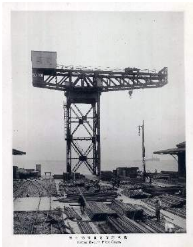
※1完成したハンマーヘッドクレーン 1917年(大正6)年