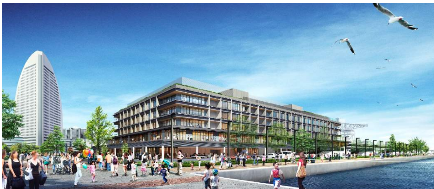
「客船ターミナル」「商業」「ホテル」一体型複合施設『YOKOHAMA HAMMERHEAD』完成イメージ