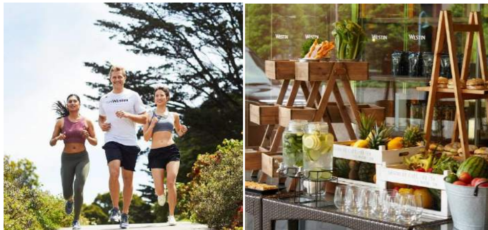
写真左：グループランニング(イメージ) 右：モーニングラン後のリカバリーコーナー(イメージ)

2019年10月に25周年を迎えるウェスティンホテル東京(東京都目黒区 総支配人チャールズ・ジャック)は、ウェスティンホテル&リゾートが掲げるブランドコンセプト「ウェルビーイング」を体現するプログラムの一つとして、「Rise to Run」のテーマのもと、ウェスティンホテル東京の「ランコンシェルジュ」と一緒に走る宿泊ゲスト向けのグループランニング「runWESTIN」を、どなたでもご参加いただけるランニングセッションとして期間限定で実施いたします。