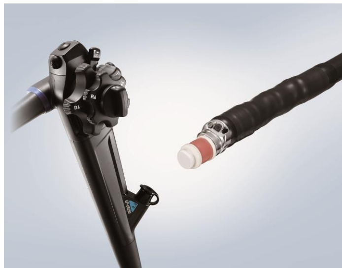
EVIS EUS超音波消化管ビデオスコープ GF-UE290