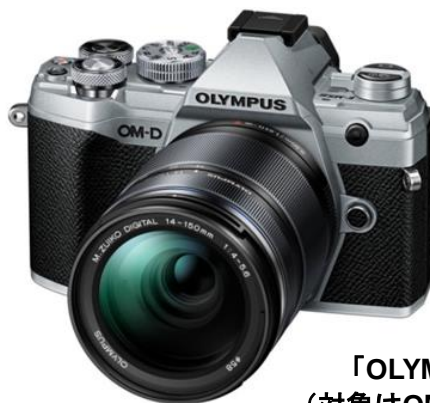
「OLYMPUS OM-D E-M5 Mark III」 (対象はOM-D E-M5 Mark IIIボディーのみ)

オリンパス株式会社は、フォトパス※ 1 会員向けサービス「オリンパス オーナーズケアプラス」(OOC+)※ 2 から、「OLYMPUS OM-D E-M5 Mark III」専用のお得なサービスプラン「OM-D E-M5 Mark III 専用メンテナンスパッケージ Lite」を 2019 年 11 月 22 日(金)より発売します。期間中は通話料無料の専用サポートデスク、定期の診断・調整および保証が最長 4 年間※ 3 受けられるなど、充実したサービスとなっています。