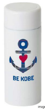
②ステンレスボトル 200ml（保温保冷）