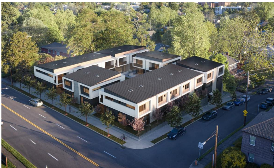
HOMMA X 完成予想図（俯瞰）© 2020 HOMMA, Inc.