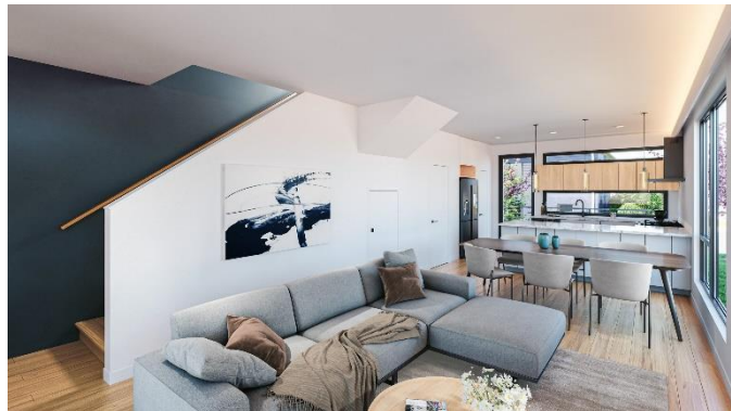
HOMMA X 完成予想図（内装）