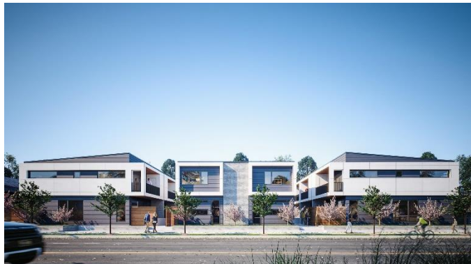
HOMMA X 完成予想図（正面）

次世代スマートコミュニティをポートランドで開発、将来のスマートシティ開発も視野に