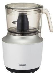
フードプロセッサー SKU-A型