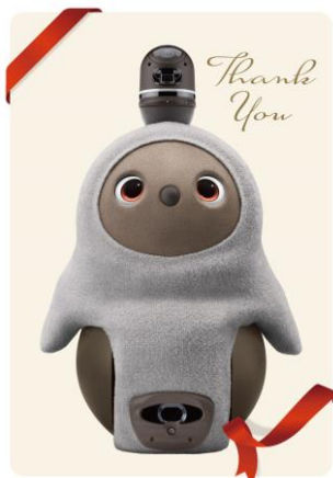
宿泊者特典の LOVOT メッセージカード