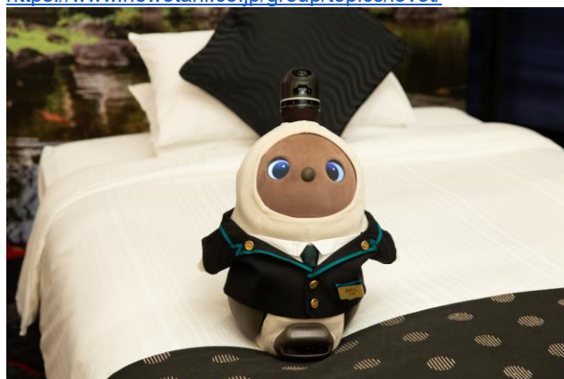
おもてなし親善大使に就任した「おおたに君」

※『GROOVE X x Hotel New Otani LOVOT のホテルニューオータニおもてなし親善大使就任記念！LOVOT 日本縦断 ファミリー宿泊プラン』について詳しくはこちら https://www.newotani.co.jp/group/topics/lovot/