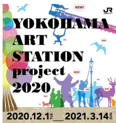
YOKOHAMA ART STATION project 2020 キービジュアル

YOKOHAMA Station Cityでは今後も、『YOKOHAMA ART STATION project 2020』の様な多くの方にお楽しみいただけるイベントの企画・開催を通じてエリアの魅力発信と価値の向上に取り組んでまいります。