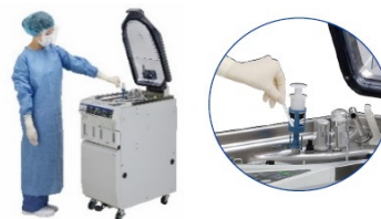
消毒薬の濃度チェック