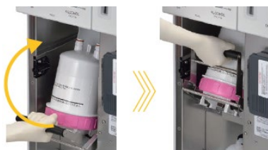
水フィルターの交換

洗浄消毒後の内視鏡に水道水の雑菌が付くのを防ぐため、装置の内部に「水フィルター」を設置して定期的に交換する必要があります。従来品は、専用の工具を用いてフィルターを取り外す必要がありましたが、「OER-6」では効率的なワンタッチ交換が可能になりました。また、これまでは屈んだ姿勢で行っていた消毒薬の濃度チェックが立ったまま行えるようになり、煩雑な作業が不要になりました。