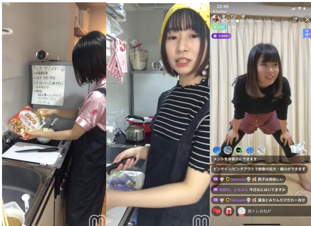
料理や筋トレの様子を配信する女子大生 / KIRINZライバー所属

2位の「筋トレ」は増加したおうち時間での運動不足解消ツールとして、また、YouTubeなどの動画コンテンツやZoomなどでオンラインで受けられるレッスンが増えたことも要因と考えられます。