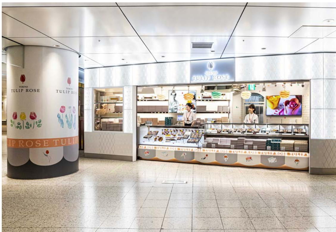
TOKYOチューリップローズJR東京駅店