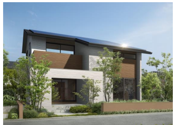
2階建て 3LDK 延床面積 104.75㎡ 建物本体価格 1,585万円(税抜)～ ※外観パースはイメージとなります。

アクюраホームグループは2020年7月に「新生活様式の家」を発表し、ウイルス対策に適応した住宅を提案してきました。しかしながら、未だ新型コロナウイルスのさらなる感染拡大や、新興種の出現など、ウィズコロナ時代は長期化することが懸念されています。感染者数の増加に伴い、ウイルス対策の方法も困難になりつつある中、注目を集めた住宅のウイルス対策を標準装備し、今後のウィズコロナの暮らしにも対応できる住宅商品「新しい生活様式の家「地球と家計にやさしい家」」を開発、発表いたしました。