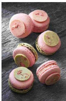
PALETAS [B2F] Macaron Sa_ku_ra