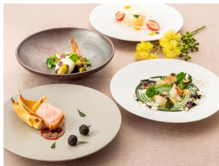
THE GRAND GINZA [13F] 春の味覚×四国エリアの食材を使った 新感覚フレンチ