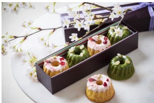
パティスリー パブロフ [B2F] クグロフ 桜&抹茶