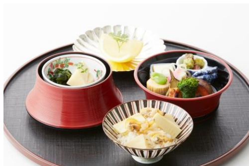
旬彩三山 [B2F] 筍ご飯と鼓弁当