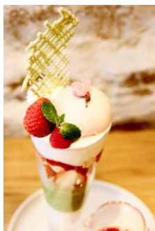
72 Degrees Juicery + Café by David Myers [5F] 桜と抹茶の彩りパフェ