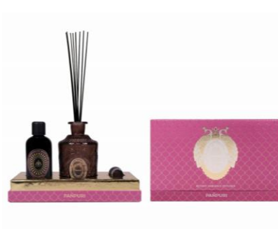
PANPURI [B1F] ディスタントショアーズ ミニ ディフューザーセット