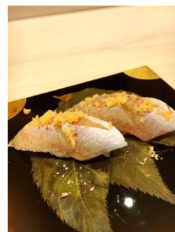
つきじ鈴富 [13F] 春子鯛の桜葉漬