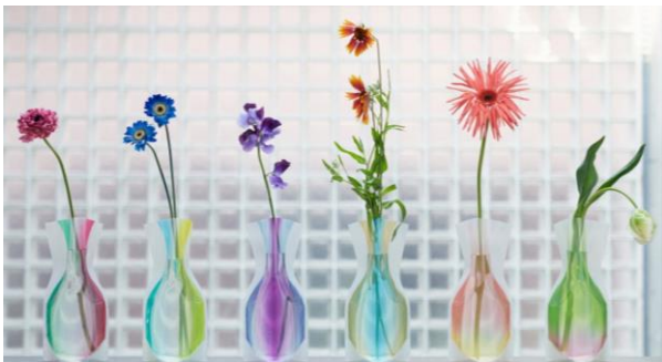
D-BROS [4F] フラワーベース