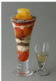
PHILIPPE CONTICINI [B2F] ヴェリーヌパフェ アグリウム ジャンジャンブル柚子