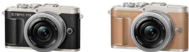
「OLYMPUS PEN E-PL9 14-42mm EZ レンズキット」 ボディー(ブラック/ブラウン) +「M.ZUIKO DIGITAL ED 14-42mm F3.5-5.6 EZ」