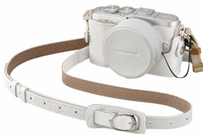
本革ボディージャケット「CS-45B」、本革ショルダーストラップ「CSS-S109LL II」および本革レンズジャケット「LC-60.5GL」を装着したコーディネート例

カメラボディーを傷から守り、ファッションアイテムとしてのコーディネートをさらに幅広いものにするための本革ボディージャケットです。カラーはホワイト、ブラック、ブラウン、ライトブラウンの 4 色、さらに発売中の同素材の本革ショルダーストラップ「CSS-S109LL II」、本革レンズジャケット「LC-60.5GL」と合わせてのコーディネートが楽しめます。(本項で紹介の本革ボディージャケット「CS-45B」、本革ショルダーストラップ「CSS-S109LL II」、本革レンズジャケット「LC-60.5GL」は発売中の製品です)