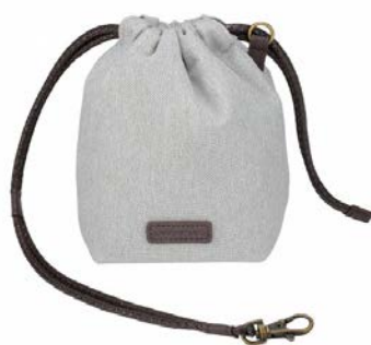
新発売のレンズケース「CS-52」

「OLYMPUS PEN E-PL9」と同時に発売となる交換レンズ収納用のコンパクトなレンズケースです。ナチュラルな色合いを楽しめる杣調(もくちょう)の生地、アンティーク調の金具など細部にこだわった仕上げになっています。ハンドストラップのように手首にかけられるスタイルのため、レンズ交換時に両手を自由に使えます。また、取り付け金具を使ってバッグの持ち手などに吊り下げられ、他の荷物とまぎれにくいなど、機能性にも十分配慮された作りになっています。収納可能なレンズは「M.ZUIKO DIGITAL ED 14-42mm F3.5-5.6 EZ」、「M.ZUIKO DIGITAL 45mm F1.8」、「M.ZUIKO DIGITAL 25mm F1.8」、「M.ZUIKO DIGITAL ED 30mm F3.5 Macro」、「M.ZUIKO DIGITAL ED 40-150mm F4.0-5.6 R」など。詳細はオリンパス web サイト( https://olympus-imaging.jp/ )をご参照ください。