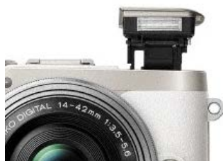
内蔵フラッシュ、ポップアップ状態