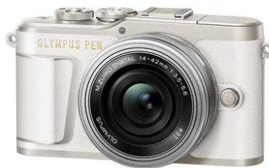
「OLYMPUS PEN E-PL9 14-42mm EZ レンズキット」 ボディ（ホワイト）+「M.ZUIKO DIGITAL ED 14-42mm F3.5-5.6 EZ」