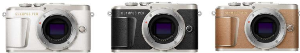
「OLYMPUS PEN E-PL9 ボディー」 (ホワイト/ブラック/ブラウン)