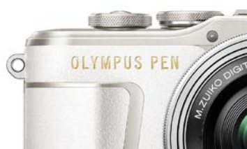
箔押しが施された上質な仕上げのボディ

「OLYMPUS PEN E-PL9」は、カメラ全体に革調素材をバランスよく配置することで、トラディショナルな雰囲気を残しつつ近代的で最先端の雰囲気を演出し、さらに箔押しや墨入れをボディに施すなど細部の仕上げや質感にこだわり、シンプルながらも上質感のあるデザインになっています。携帯性にも優れ、標準ズームレンズの「M.ZUIKO DIGITAL ED 14-42mm F3.5-5.6 EZ」と組み合わせても 500ml のペットボトル 1 本よりも軽く、手のひらに乗るコンパクトなサイズも実現しています。また、グリップ形状を工夫することで、よりしっかり握れるように作られています。お好みのスタイルに合った 1 台を選んでいただけるよう、ボディカラーはホワイト、ブラック、ブラウンの 3 色が用意されています。