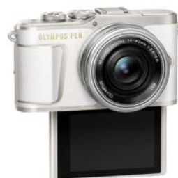
液晶モニター下開きイメージ