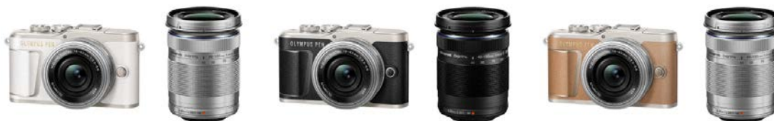
「OLYMPUS PEN E-PL9 EZ ダブルズームキット」 ボディー(ホワイト/ブラック/ブラウン) +「M.ZUIKO DIGITAL ED 14-42mm F3.5-5.6 EZ」 +「M.ZUIKO DIGITAL ED 40-150mm F4.0-5.6 R」