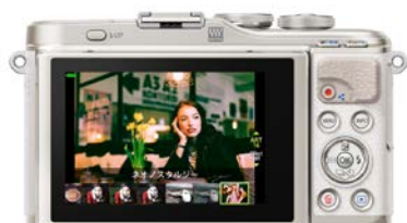
新アートフィルター 「ネオノスタルジー」表示例

人気のセルフィー(自分撮り)に対応し、静止画でも動画でも、液晶モニターの画面をタッチするだけで気軽に撮影を楽しめるタッチ AF シャッター機能も備えています。液晶モニターは 180 度下側に動き、タッチ操作した際の指の写りこみを気にせず撮影できます。この液晶モニターを 180 度下側に動かすと、モニターに映る画像が自動でミラー表示に切り替わり、e ポートレート、シャッター、動画撮影、再生、セルフタイマー切り替えなどの設定が液晶モニター上のタッチ操作で可能になります。