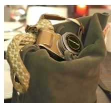
「OLYMPUS Image Share」 使用イメージ

※3 Android 搭載の場合、スマートフォンの OS のバージョンが Android 6.0 以降の場合には、スマートフォンが利用されていない状態(スマートフォンの画面が消灯している状態)では自動で画像が転送されません。スマートフォンの画面を表示した状態にしておく必要があります。iOS 搭載機の場合はあらかじめ OLYMPUS Image Share (OI.Share) を起動しておく必要があります