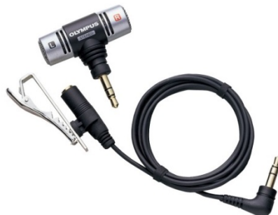
ステレオマイクロホンセット「ME51SW」

延長ケーブルに小型のタイピンクリップが備わっており、VP-15本機がポケットに収まらない場合も、クリップを装着することでスマートに録音できます。