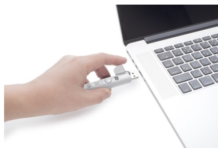
「VP-15」をパソコンと接続したイメージ