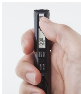
REC スwitchをスライドさせたイメージ

セルフタイマー機能を使えば、あらかじめ設定した時間に録音を自動開始できます。録音開始時間は 3 分後、5 分後、10 分後の 3 パターンからシチュエーションに応じて選択可能です。