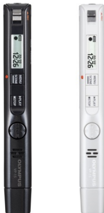
Voice-Trek VP-15 (メタリックブラック/パールホワイト)