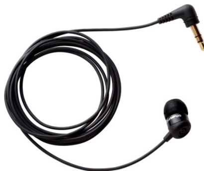
テレホンピックアップ「TP8」

インナーイヤードーム方式の電話録音用マイクです。ICレコーダーのマイク端子につなぎ、マイク部分を装着し通話すれば、話した内容を明瞭に録音できます。スマートフォンや携帯電話でも使用可能です。