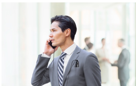
「TP8」との併用イメージ

USB 端子も備えており、カバーを外すだけでパソコンへダイレクトに接続できます。ケーブルやソフトウェアなしでの録音データのやり取り、本体に装填したニッケル水素充電電池への充電も可能です。