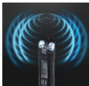
全指向性ステレオマイクのイメージ