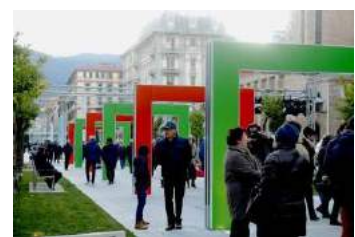
《歩く》展示風景、恒久設置、ヴェルディ・広場、ラ・スペツツィア、イタリア、2016年