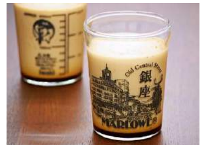
マーロウ [B2F] 銀座店限定ビーカー入りプリン 850 円