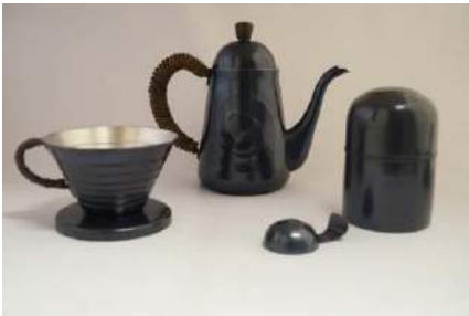
玉川堂 [4F] コーヒーポット(700ml) 170,000 円 コーヒーストッカー(100g)スプーン付 60,000 円 ドリッパー 35,000 円