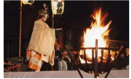
※上記は薪能のイメージ写真であり、実際の公演内容とは異なります。

※参加条件等の詳細は後日GINZA SIX公式WEBサイトにてお知らせいたします。