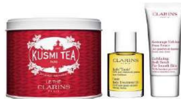
CLARINS [B1F] 紅茶とスキンケアのセット 6,500 円