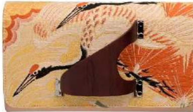
PERRIN [2F] KIMONO CLUTCH BAG 166,000 円