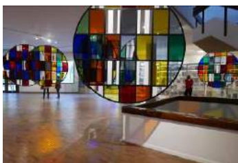
《半円から円へ:色彩の旅》展示風景、ボコタ近代美術館、ボコタ、コロンビア、2017年 © DB-ADAGP Paris