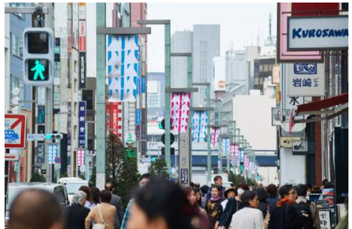
GINZA SIX 中央吹き抜けの新作インスタレーションと連動したアート作品を全長1,100メートルの銀座・中央通りに展示(イメージ) © ADAGP, Paris & JASPAR, Tokyo, 2018 G1226