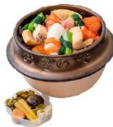
荻野屋 [B2F] GINZA SIX 1周年記念 釜めし 祥 3,900 円