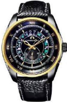
CITIZEN FLAGSHIP STORE TOKYO [1F] Campanola メカニカルコレクション GSIX 限定セット 1,250,000 円