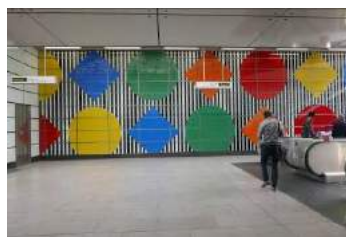
《四角と円》恒久設置、トッテンハム・コート・ロード駅、ロンドン、イギリス、2008-2017年