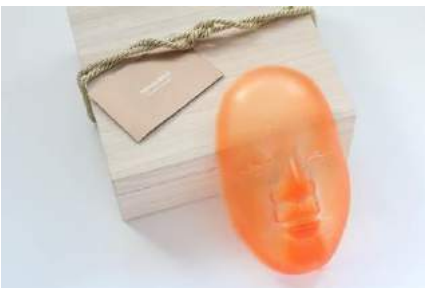
PAPABUBBLE [B2F] 飴で作った能面桐箱入り 4,630 円