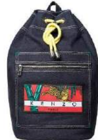
KENZO [3F] Memento N°2 mini backpack 36,000 円