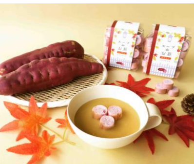
ふふふあん by 半兵衛麴 [B2F] スープ de お麴 紫いも