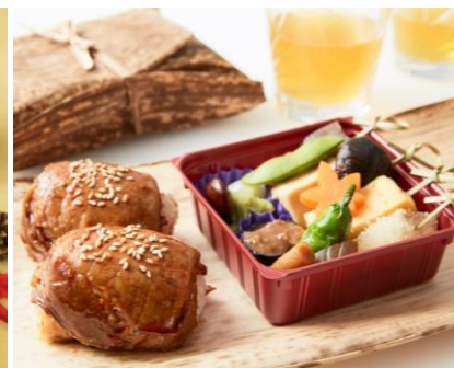
旬彩三山 [B2F] 肉巻きむすび弁当