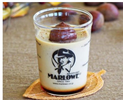
マーロウ [B2F] 栗スペシャルプリン