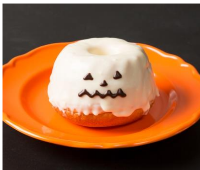
Viennoiserie JEAN FRANCOIS [B2F] かぼちゃのクグロフ