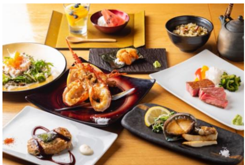
TEPPANYAKI 10 GINZA [6F] 秋食材とキャビア添え 贅沢おまかせコース