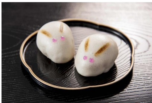
菓子匠 末広庵 [B2F] 月みてはねる