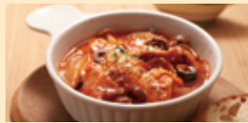
鶏肉としめじのトマトソース煮