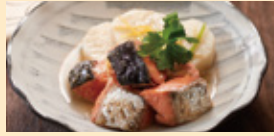
甘塩鮭と長芋の煮物