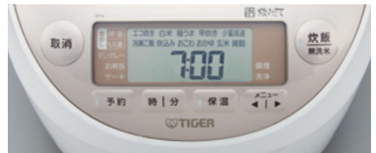
▲シンプルで大きな液晶画面