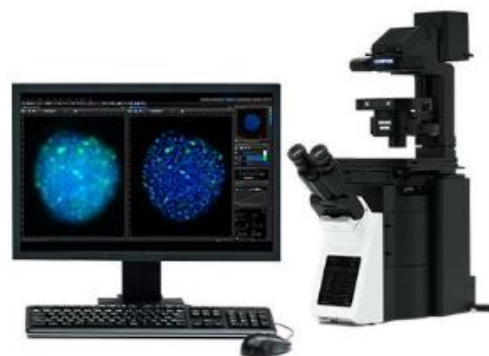
イメージングソフトウェア「cellSens」の使用イメージ