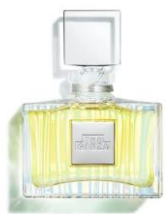
ザ・ギンザ パルファム 20ml 40,000円（税抜）