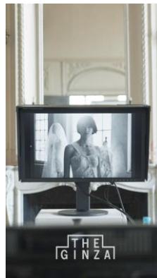
メイキングムービー