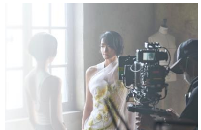
▲オフィシャル動画撮影時の様子