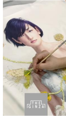
メイキングムービー