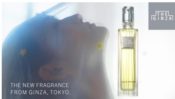
オフィシャルムービー