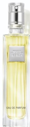
THE GINZA EAU DE PARFUM

資生堂の子会社で化粧品の開発・企画・販売等を行う株式会社ザ・ギンザは、タイムレスな本質を追求するプレステージスキンケアブランド「ザ・ギンザ (THE GINZA)」から、初のフレグランス「ザ・ギンザ パルファム」「ザ・ギンザ オードパルファム」を2021年1月8日（金）より日本国内の直営店・オンラインショップにて先行発売し、2月1日（月）より「ザ・ギンザ オードパルファム」を国内免税店舗にて発売を開始いたします。