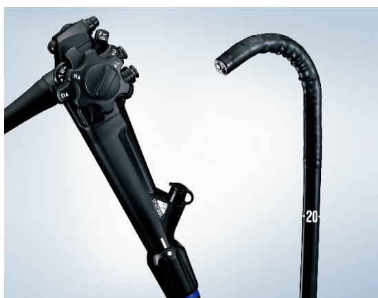
大腸ビデオスコープ OLYMPUS CF-XZ1200 シリーズ