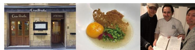
Casa Urola（カーサウローラ）サンセバスティアンで一番人気の野菜バル