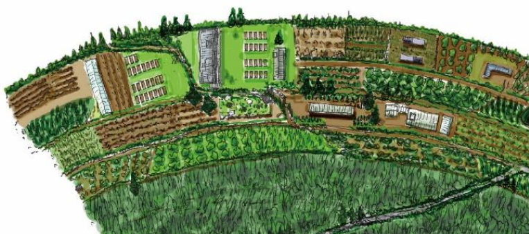
オーガニック農園