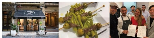
Zazpi（サスビ）世界ピンチョス大会チャンピオンの店