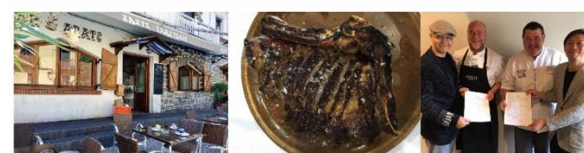
ARATZ（アラッツ）サンセバスティアン市町お勧めの熟成肉レストラン