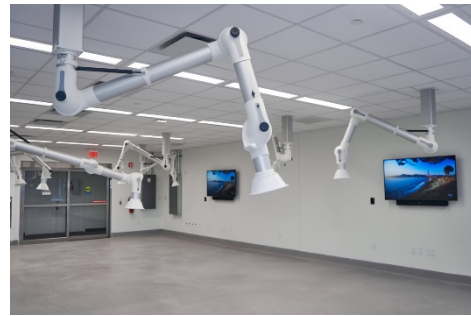
Olympus Continuum Training and Education Center