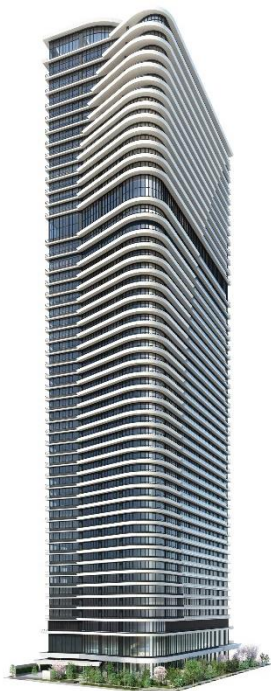
外観イメージ(南東側)

また、本プロジェクトは、大阪で初めて「宿泊施設の整備に着目した容積率緩和制度」の適用による、大阪市による特定街区の都市計画決定を受けた開発です。アフターコロナを見据え、大きな注目が集まる2025年に向けて、ますます発展する大阪の国際競争力強化に寄与し、大阪のシンボルとなる開発を実現します。