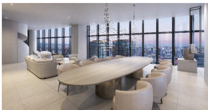
上:建物上部外観イメージ 下:内観イメージ(住宅共用部)