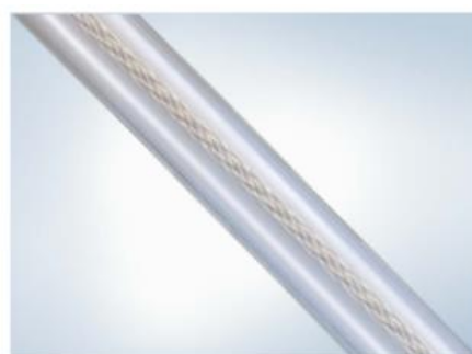
右：適度な硬さを持たせたシース