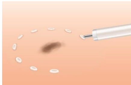
左：マーキング イメージ図

従来、医師は ESD を行う際、自分の経験や好みに応じて複数のナイフ系の処置具を使い分けて、マーキングやプレカットを行っていました。今回本製品で、マーキングとプレカットの両方に対応したことで、処置具の入れ替えに要していた時間を削減し、治療の効率向上に貢献します。