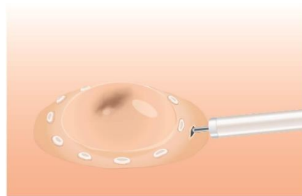
右：プレカット イメージ図