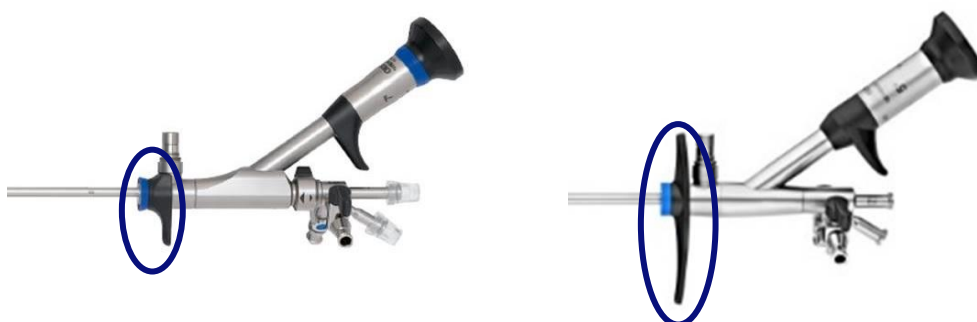
左：従来機種、右：OES ELITE ウレテロレノスコープ

人間工学に基づいたハンドル操作部のデザインにより、安定したスコープ操作をサポートし、医師の負担低減に寄与します。