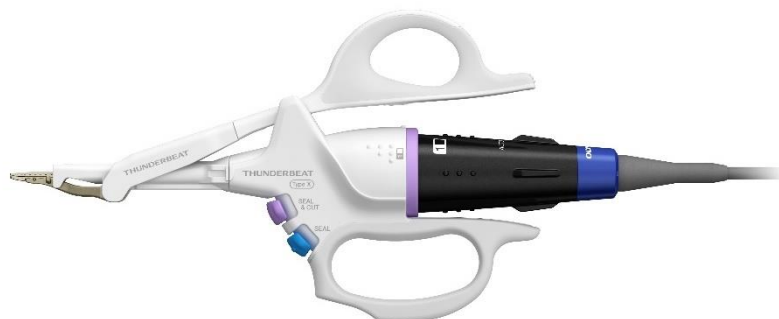
THUNDERBEAT Open Fine Jaw Type X