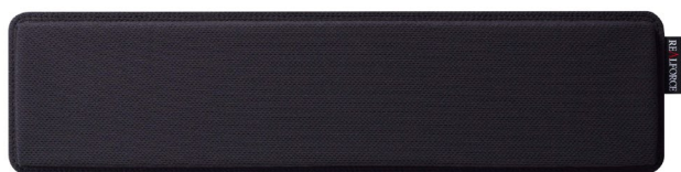
ジェル リストレスト 3/6 発売

GX1 用のオプション品として、長時間の使用でも快適性が持続する「ジェル リストレスト」(型番 M080201、製品価格 7,920 円税込) が GX1 と同時発売される他、より高速な入力と静音性を向上させる「GX1 キースペーサーセット」(日本語配列用および英語配列用) も近日発売予定です。