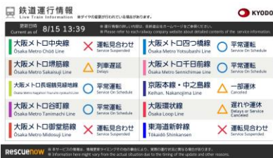
鉄道運行情報