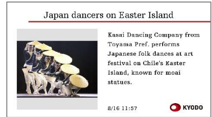
ニュース情報