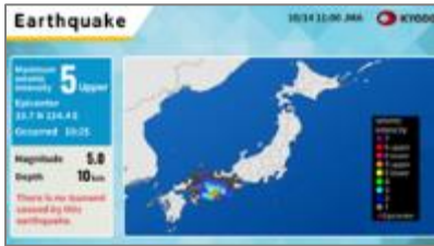
地震情報