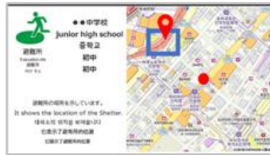
避難情報