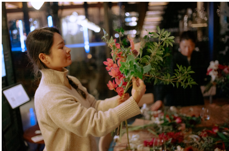
イベントイメージ