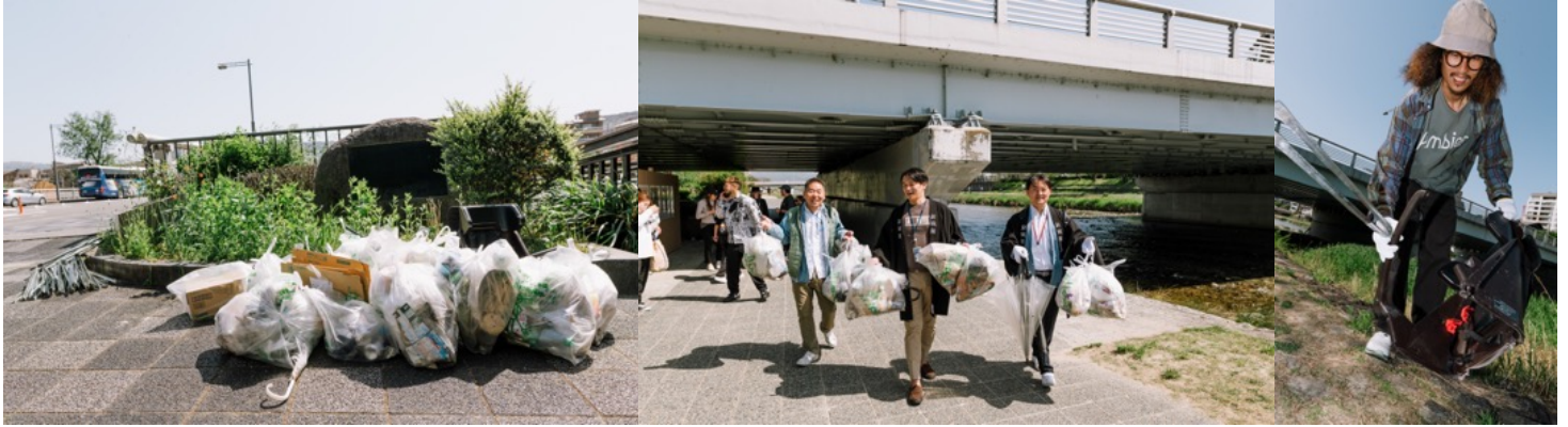
昨年のゴミ拾いの様子

今年で3年目。エースホテル京都をはじめ、新風館のテナントスタッフの有志が集まり、京都の町のゴミ拾い活動を行います。 昨年2023年はおよそ40名が集まり、約1時間ほどでゴミ14袋を集めました。