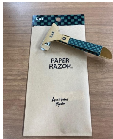
Ace Hotel Kyotoデザインの オリジナル紙カミソリ®

※インテージSRI+データ使い捨てカミソリ市場2021年7月～2022年6月推計販売数量