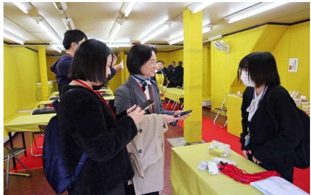
▲12月7日(土)からスタートした平戸観光協会主催のイベント「カステラ イエロー イマーシブ」でカステラバイキングを楽しみました。

Will Smart は平戸市での実証運行を通じて得られたフィードバックをもとにさらなるサービスの改善を図り、新たな交通手段の選択肢の一つとして公共ライドシェアを確立したいと考えています。今後も地域の皆様と協力しながら、交通空白地の解消に向けた取り組みを進めてまいります。