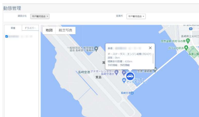
▲動態管理画面のイメージ