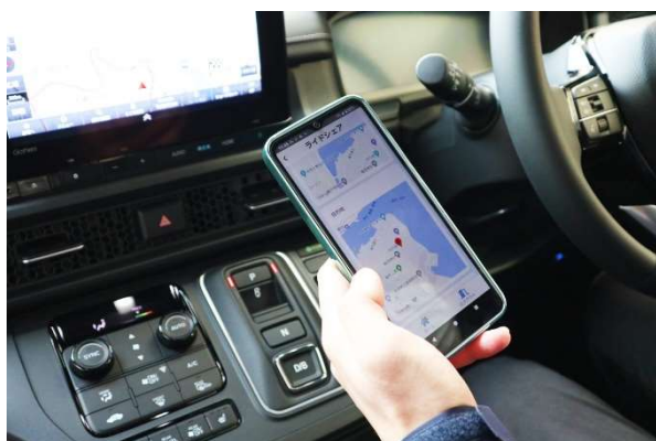
▲ライドシェアの車内でドライバー用アプリを操作する様子

利用者予約システム、運行管理/予約管理システム、ドライバー用アプリ、IoT 車載デバイスなどライドシェアの運営に必要な機能を一括で提供。運行管理者、ドライバーならびに乗客の利便性に配慮した設計となっています。乗客は利用者予約システムから日時と出発地点、到着地点を指定し、乗車予約を行います。運賃は定額制と距離制を選択することが可能で、予約時に支払いを済ませます。ライドシェアで使用する車両には IoT 車載デバイスを搭載しており、デバイスから取得したデータはリアルタイムで運行管理/予約管理システムに蓄積されます。運行管理者は運行管理/予約管理システムで GPS の緯度・経度情報から車両の走行ルートを確認したり、法定外の速度や実車状態での長時間の停車などを把握できるため、ライドシェアの利用において不安視される安全性の確保に役立ちます。ドライバーは専用のアプリで出発地点と到着地点を確認して乗客を迎えに行きます。アプリには初めて運行業務を行う方にもわかりやすい業務ナビゲーションが搭載されており、実車・降車などのステータス変更や、運賃計算等の機能が含まれています。これにより一般ドライバーでも安心して運行業務を行うことができます。