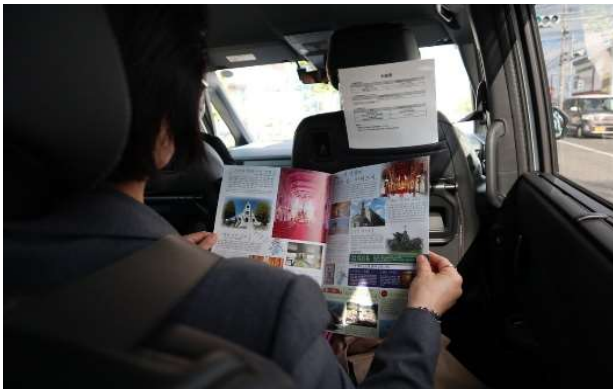
▲ライドシェアの車内では平戸の観光パンフレットなどを見て過ごしました。

わたしたちはクリスチャンなので、以前から平戸ザビエル記念教会や隠れキリシタンにまつわる世界遺産に興味があり平戸を訪れてみたいと思っていました。しかし、長崎空港からの移動の足を確保するのが難しく、実現していませんでした。このライドシェアは平戸観光協会のホームページを見て知り、オンラインで予約しました。バスや電車を乗り継いで長崎空港から平戸まで来るのは大変だと思いましたが、ライドシェアを利用することで快適に旅をすることができました。道中では海沿いを列車が走る風景がとても美しく、印象に残っています。今日はこれから平戸城の城泊を利用するのを楽しみにしています。